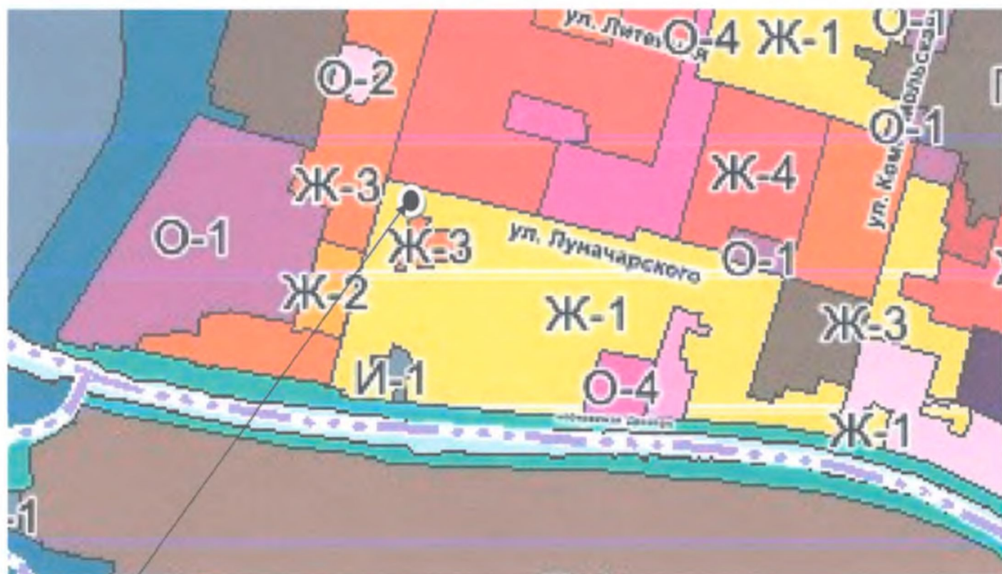
Расположение земельного участка.

Иллюстрация №3. расположение рассматриваемого земельного участка в пределах карты градостроительного зонирования территории.